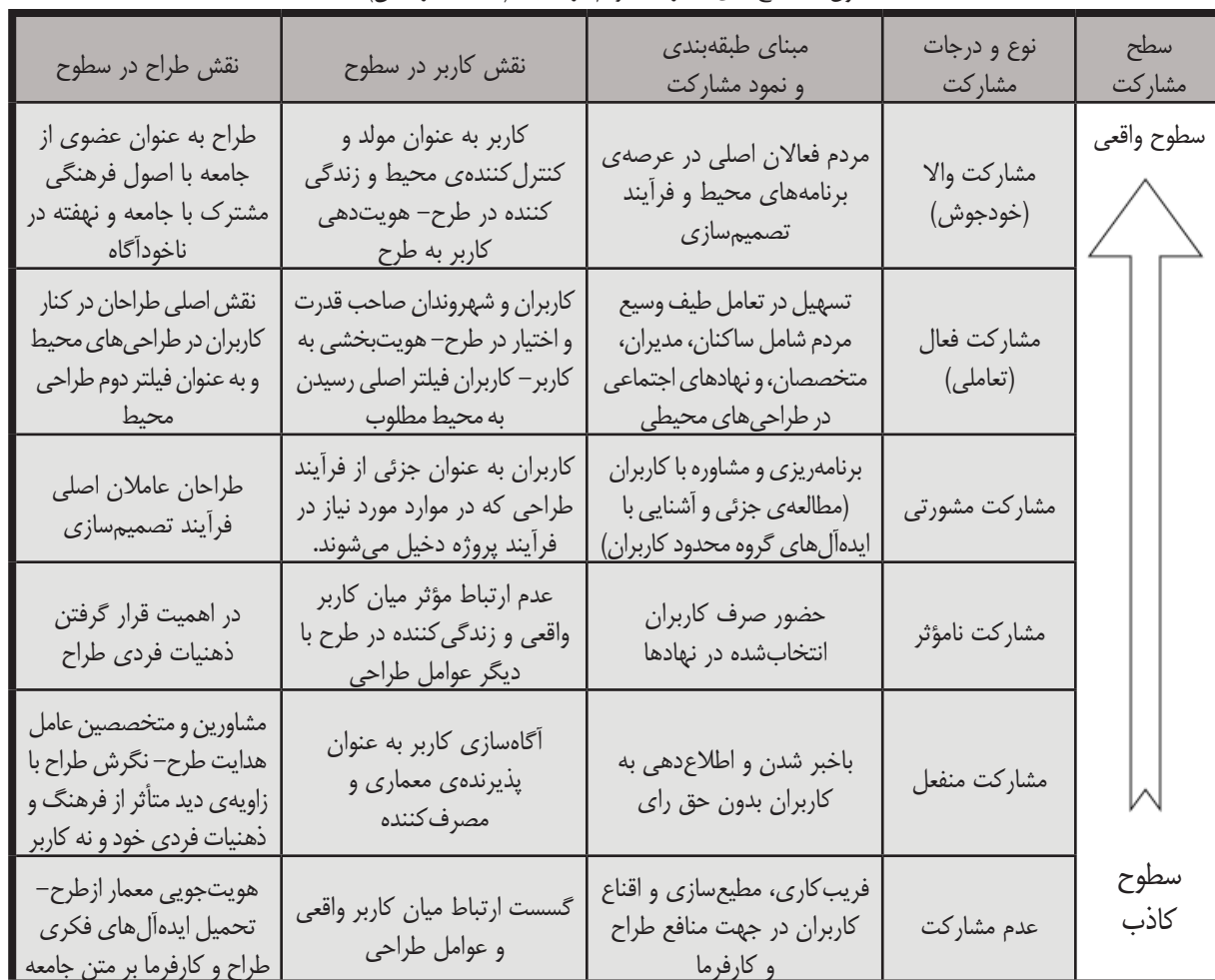
جدول ۱. سطح‌بندی مشارکت مردم در محیط

(انسان‌محور)، درصدد پاسخگویی به مسائل طراحی و توجه و تحقق اهداف انسانی صرف با پیروی از تمایلات کاربران یا الگوهای رفتاری ناخودآگاه کاربران (ناری‌قمی ۱۳۹۴) در طراحی مطرح می‌شود. مشارکت اجتماعی که در آن مشارکت به عنوان کنش اجتماعی مطرح می‌شود و بر دخالت دادن گروه‌های اجتماعی به صورت جمعی، آگاهانه، داوطلبانه، با اهداف معین و بر سهیم شدن در نفع اجتماعی تأکید می‌گردد (یزدان‌پناه ۱۳۸۶). در میان نظریه‌های مشارکتی غرب، آنچه که مشارکت‌کنندگان بر آن توافق دارند؛ مراحلی است که فرآیند برنامه‌ریزی و طراحی مشارکتی را در برمی‌گیرد: شامل زمینه، افراد مشارکت‌کننده، سطح مشارکت و زمان مشارکت (اسلامی ۱۳۹۲، ۲۶). مشارکت شهروندان به عنوان یک ضرورت در حوزه‌های مختلف نظیر برنامه‌ریزی، مدیریت و طراحی جمعی مطرح می‌گردد؛ که طبق مطالعات انجام گرفته در سطوح و درجات