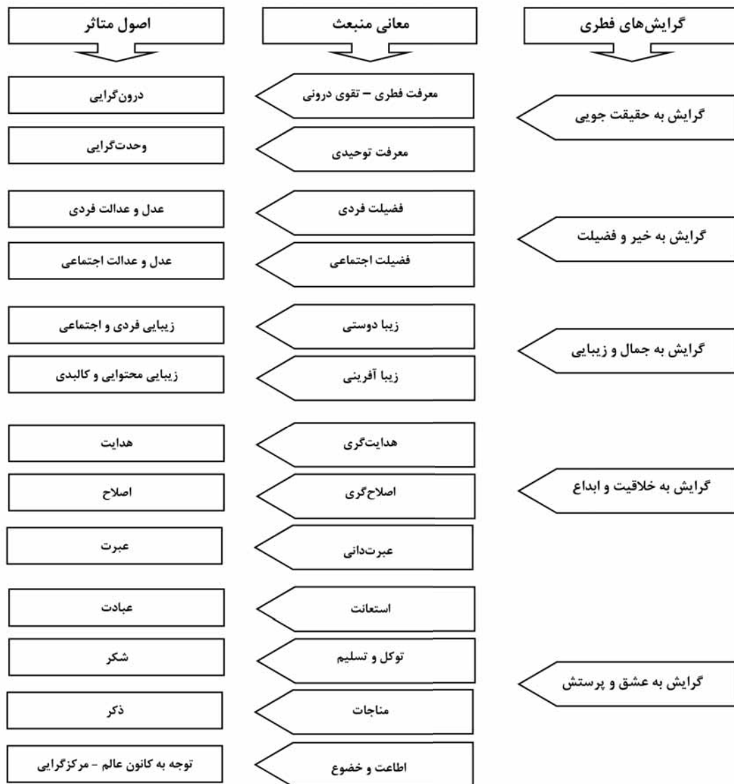
نمودار ۲. معانی و اصول منبعث از گرایش‌های فطری بر مبنای استدلال‌ها.

در رأس آن قرآن، سیره‌ی پیامبر و معصومین (ع) عرضه کرده‌است. اصول شریعت که منطبق بر عقل و به تبع آن گرایش‌های فطری انسان در پاسخ به دو ساحت بینش و گرایش‌ها یا دانسته‌ها و خواسته‌های او در جهت رسیدن به زندگی عقلانی و کمال معنوی انسان می‌باشد. مؤلفه و شاخص‌هایی که در پنج گروه گرایش و خواسته‌های روحی و فطری او گرایش به حقیقت‌جویی و رسیدن به کمال، خیر و فضیلت، جمال و زیبایی، خلاقیت و ابداع و عشق و پرستش قابل دسته‌بندی می‌باشد و چون پاسخی است به تمام نیازهای وجودی او؛ این گرایش‌ها زمینه آرامش