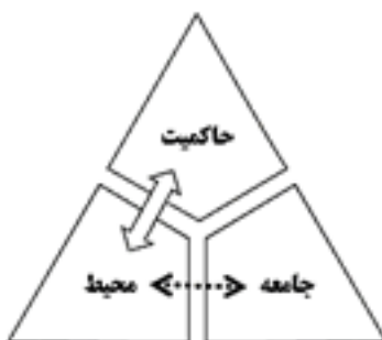
نظام استبدادی، محیط کنترل شده استبدادی

در جوامع لیبرال تصمیم‌گیری برای محیط مصنوع در سیر تحول خود به نوعی معتدل‌تر شده و با پررنگ‌تر کردن نقش دولت‌ها، توجه به ضرورت‌ها را نیز در دستور کار خود قرار داده است. بنابراین مداخلات محیطی در نظام‌های