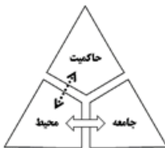
نظام سوسیال، محیط کنترل شده اجتماعی