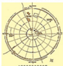
فیروزآباد، استبدادی محیط کنترل‌شده استبدادی