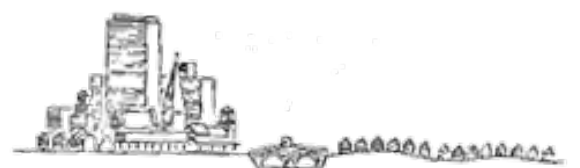
ترکیب ناهمگون بافت تاریخی و جدید در بخش قدیمی شهر شکل نادرست تفکیک محیط آزاد و کنترل شده در توسعهٔ شهر