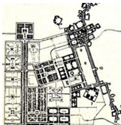
تصویر ۴. تلفیق یافت هندسی و ارگانیک در اصفهان صفوی در اثر توجه همزمان به آزادی و ضرورت

در اصفهان دوره صفوی تقسیمات شهر به گونه‌ای شکل گرفت که زاینده‌رود محور جداکننده محلات گروه‌های مذهبی مختلف مردم بود. جلفا محل سکونت آرامنه و گبرآباد محل سکونت زرتشتیان در حاشیه جنوبی زاینده‌رود بود. شمال زاینده‌رود نیز به مسلمانان اختصاص داده شد. محله جدید عباس‌آباد برای اسکان مهاجران توسط شاه‌عباس و خیابان چهارباغ به عنوان راه ارتباط‌دهنده محله‌های شهر با یکدیگر و با خارج از شهر ساخته شد. آنچه در عصر صفوی در تحولات محیط به منظور رفع نیاز ساکنان اتفاق افتاد؛ نمود اجرای یک طرح کاملاً هندسی و منظم به قصد پاسخگویی به نیازهای حکومت در کنار بستر کاملاً ارگانیک شهر ناشی از حیات گذشته آن و توجه به بستر فرهنگی آن بود (پاکزاد ۱۳۹۰، ۴۰۱-۴۰۴). در توسعه جدید شهر تقسیماتی بر اساس فرهنگ قومیت‌های ساکن در آن ایجاد شد که در هر منطقه می‌توان آزادی‌های لازم برای اقوام را فراهم کرد. همچنین الگوی چهارباغ که میان محلات پیوند برقرار کرده و عناصر مورد نیاز حاکمیت را در شهر جانمایی