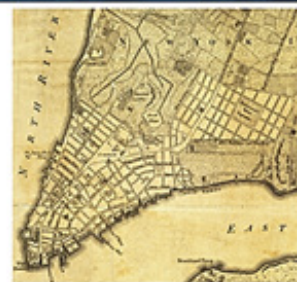
نیویورک، لیبرال دموکراسی محیط آزاد