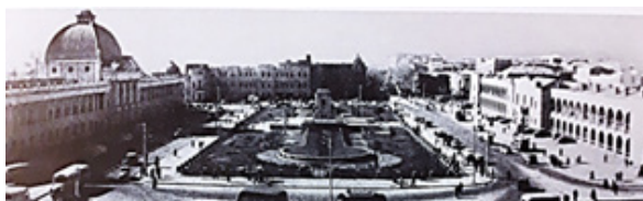
پهلوی اول، محیط کنترل شده استبدادی