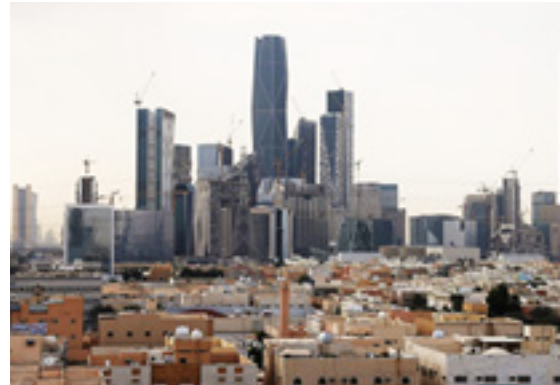
ریاض، لیبرال اسلامی محیط آزاد

تصویر ۱. انواع محیط آزاد و کنترل شده در شهرهای سوسیالیستی، لیبرالیستی و استبدادی (پادشاهی دینی)