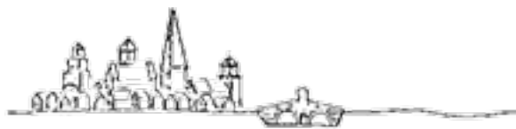
شکل اولیهٔ شهر: هویت تاریخی، تنوع و همزیستی

آنچه که کرییر به عنوان راه‌حل محیط‌های آزاد در نظام لیبرال معرفی می‌کند؛ گویای لزوم توجه به ضرورت‌های موجود در الگوهای منطقه‌ای است که ریشه در سابقهٔ فرهنگی و نحوهٔ زندگی اجتماعی در آن مناطق دارد. این سبک مداخله در مقابل قواعد استاندارد شدهٔ وابسته به سبک بین‌المللی قرار دارد و قواعد خود را با توجه به شرایط مکانی و زمانی محیط و در هماهنگی با معماری منظرها و شهرهای موجود اخذ می‌کند. در واقع کرییر هر نوع مداخله در محیط را ملزم به رعایت سبک معماری تاریخی هر منطقه و روش‌های پیشینیان آن می‌داند. این روش‌ها که ریشه در هویت معماری هر منطقه دارد، به حفظ هویت محیط متناسب با نیازهای هر منطقه منجر می‌شود (کرییر ۱۳۸۹، ۲۱).