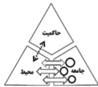
نظام لیبرال، محیط آزاد

تصویر ۲. مقایسه عوامل اثرگذار بر محیط در نظام‌های سوسیال، لیبرال و استبدادی (مأخذ: نگارندگان)