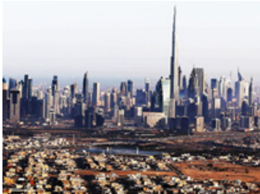
دبی، لیبرال اسلامی محیط آزاد