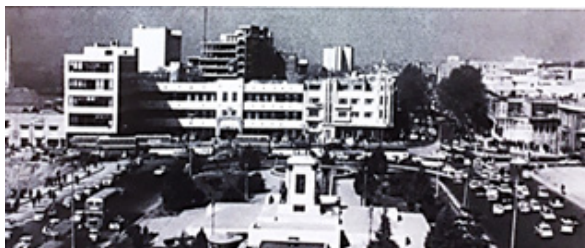
پهلوی دوم، محیط آزاد