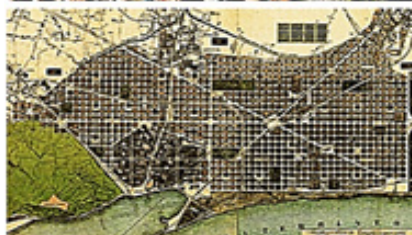
بارسلونا، سوسیال محیط کنترل‌شده اجتماعی