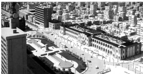
جمهوری اسلامی، تلاش برای بازگشت به محیط آزاد مطالعه شده